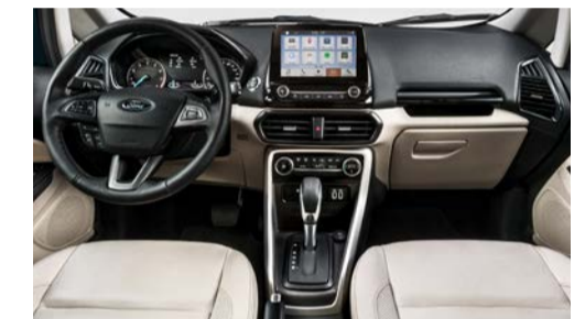
Interior EcoSport Titanium Sync 3® com tela de 8" e Nova Transmissão Automática