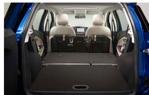
Assolho inteligente do porta-malas