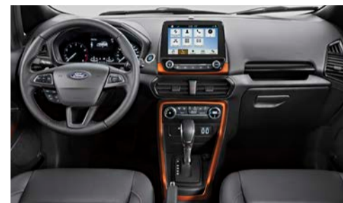
Interior EcoSport Storm Sync 3® com tela de 8" e Nova Transmissão Automática