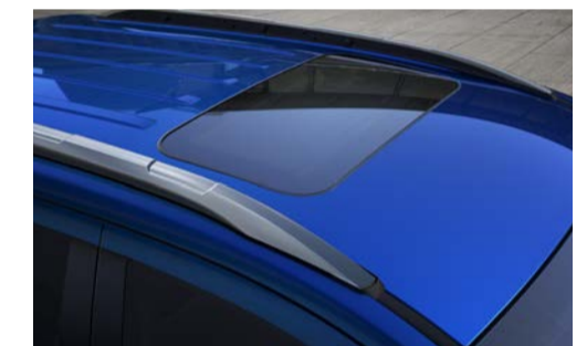
Teto solar elétrico